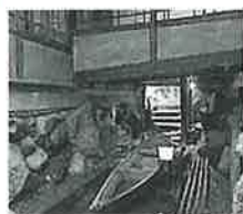
小舟が出入りした水路跡