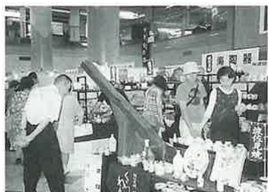
6月に開催した波佐見焼枚方展

今後は、このような民間レベルの交流がますます発展し、波佐見焼の販路拡大につながるよう期待されているところです。