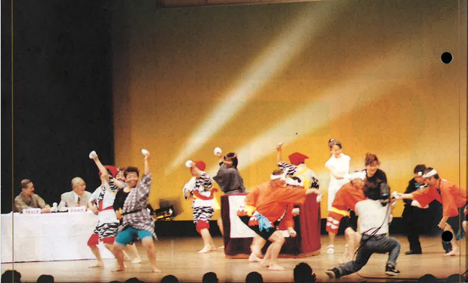
表紙は、波佐見焼400年祭記念事業として行われた「出張!なんでも鑑定団」のテレビ収録の場面です。