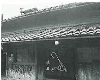
江戸時代に船宿として栄えた旧京街道沿いに立つ鍵屋