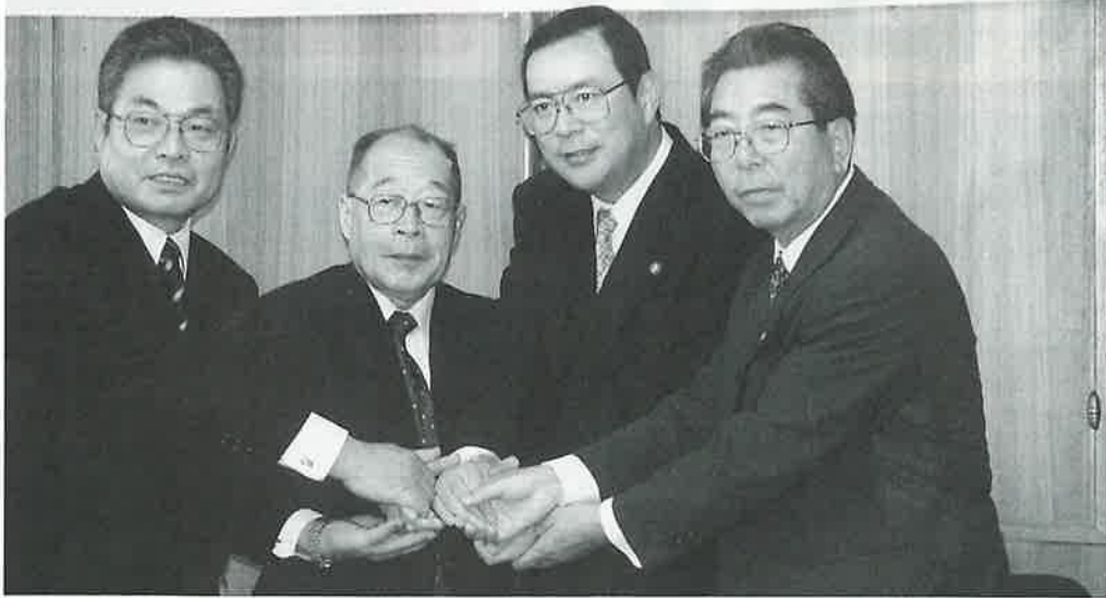
左から一瀬町長・大西天川村長（奈良県）・中司枚方市長・館林王滝村長（北海道）