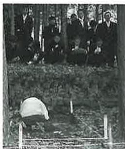
発掘現場を見学する生徒たち

郷土の歴史や産業への認識を深めただけでなく、地元の方々や心をかよわせる絶好の機会となりました。