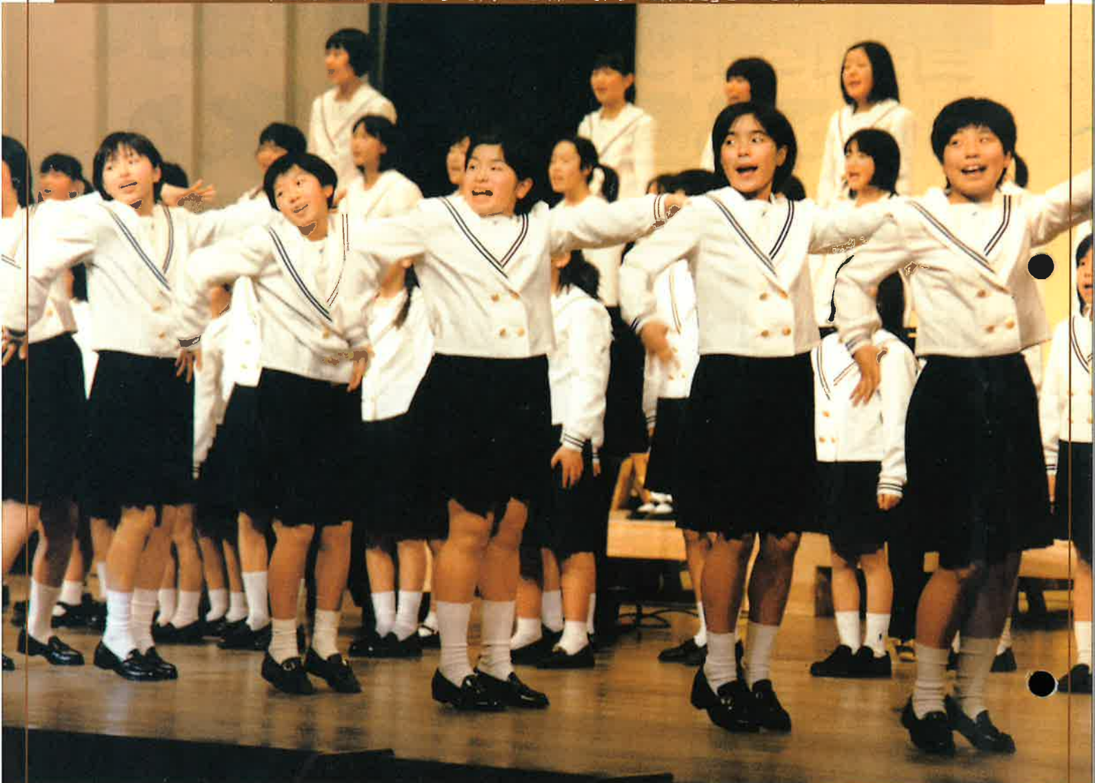
表紙は、町民音楽祭で発表する児童合唱団のみなさんです。 (関連記事2ページに掲載)