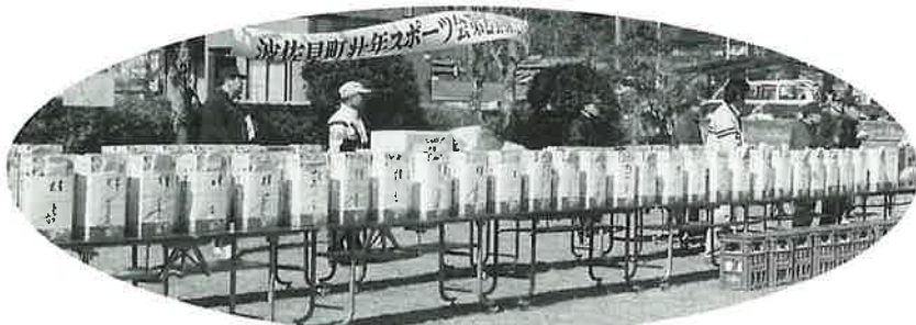
ズラリと並ぶ町内116件から寄せられたスポンサー賞