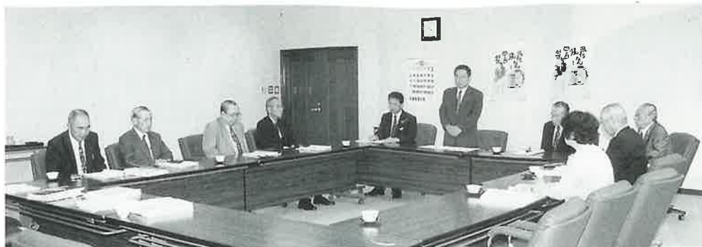
1年間にわたり開かれた行政改革委員会

町は、昭和60年に第1次大綱を、平成8年に第2次大綱をそれぞれ定め、行政改革を進めてきましたが、昨今の社会情勢の変動に対応し、さらに効率的な行政運営を進めるため今回第3次大綱を定めました。