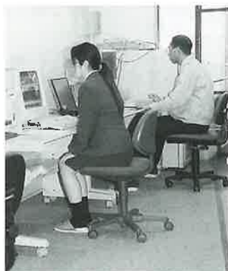
12年度から本格的に稼働する役場電算室