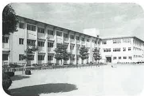
永尾分校の統合が予定される東小学校

これを受け町教育委員会でも何回となく検討を重ねるとともに、地元のみならず協議の結果、児童数が急激に減少することが予想される5年後に再度統合について、検討協議することとし、改めて『覚書』が取り交わされました。よって、永尾分校の統合は、本年4月1日から5年間、延長されることとなりました。