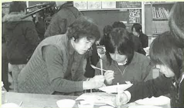
▲伝統工芸士に手ほどきを受ける波佐見高校生