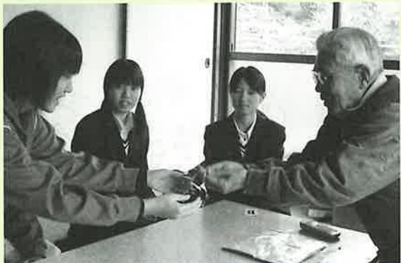
▲交通安全の願いを込めた折鶴を手渡す中学生

参加した高校生や中学生は、「交通事故に遭わないよう気をつけて、これからも長生きしてください」など、声をかけ交通安全啓発に努め、高齢者の方も高校生、中学生の訪問を大変喜んでいらっしゃいました。