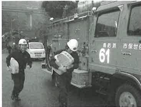
平成18年佐世保市消防局管内火災発生件数

昨年、本町の火災発生件数は8件で、うち1件が全焼扱いとなる火災でした。最近はストーブが原因と思われる火災が多発しています。ストーブ等の付近には燃えやすい物を置かないこと、また乾燥機代わりにストーブを使わないことに気をつけるなど、暖房器具の取扱には十分注意してください。